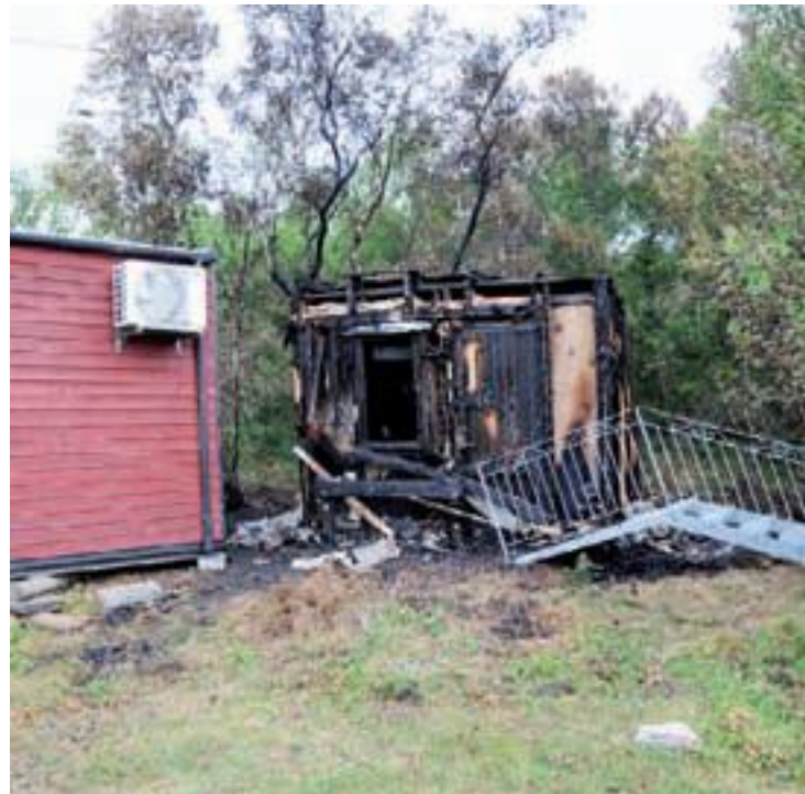
Utrent. Telekiosken er helt utrent, men allerede i helga var en ny kiosk kommet på plass.