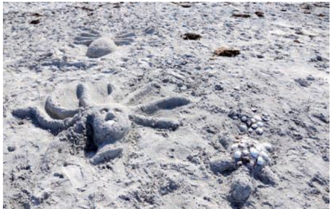
Fossiler. Disse fossilene dukket opp på Bøsandene denne uka. Noe for forskere?