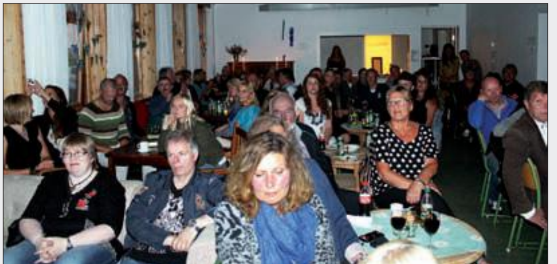
Begeistret publikum. 84 betalende tilhørere koste seg i den varme sommerkvelden med heftige blueslåter.