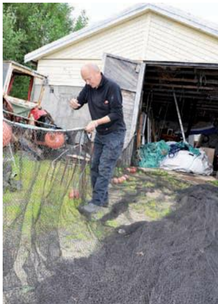
Sildefiske på vinteren. Han må langt ut i Vestfjorden vinterstid for å få fatt på silda.