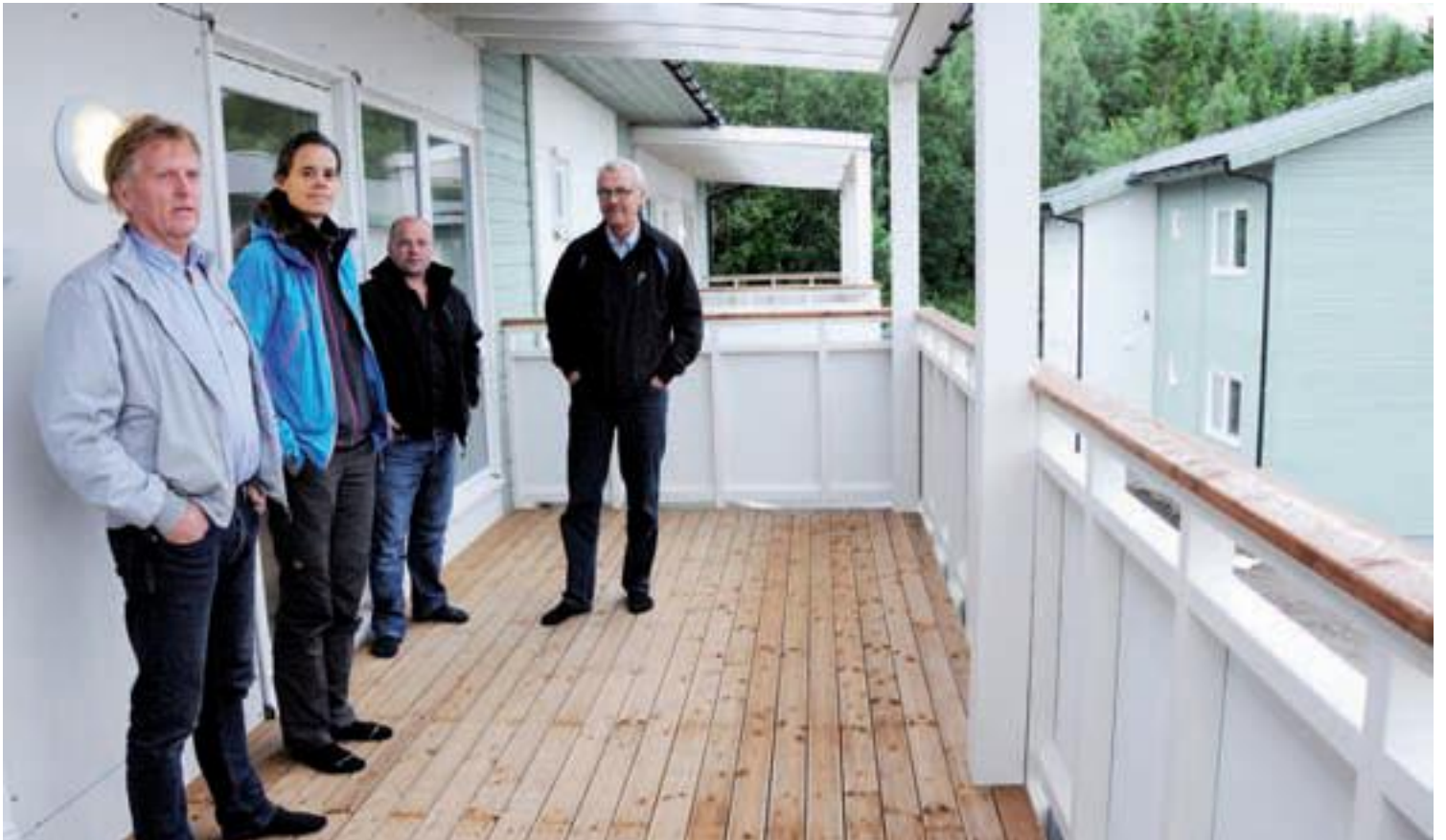
Store terrasser. Store sørvendte terrasser gjør leilighetene luftige og lyse.

Steigen Bolig har også brukt lokale entreprenører der det har vært mulig. I tillegg er alle hvitevarene kjøpt lokalt. Så dette er også god butikk for det lokale næringslivet. Og Strømseth er