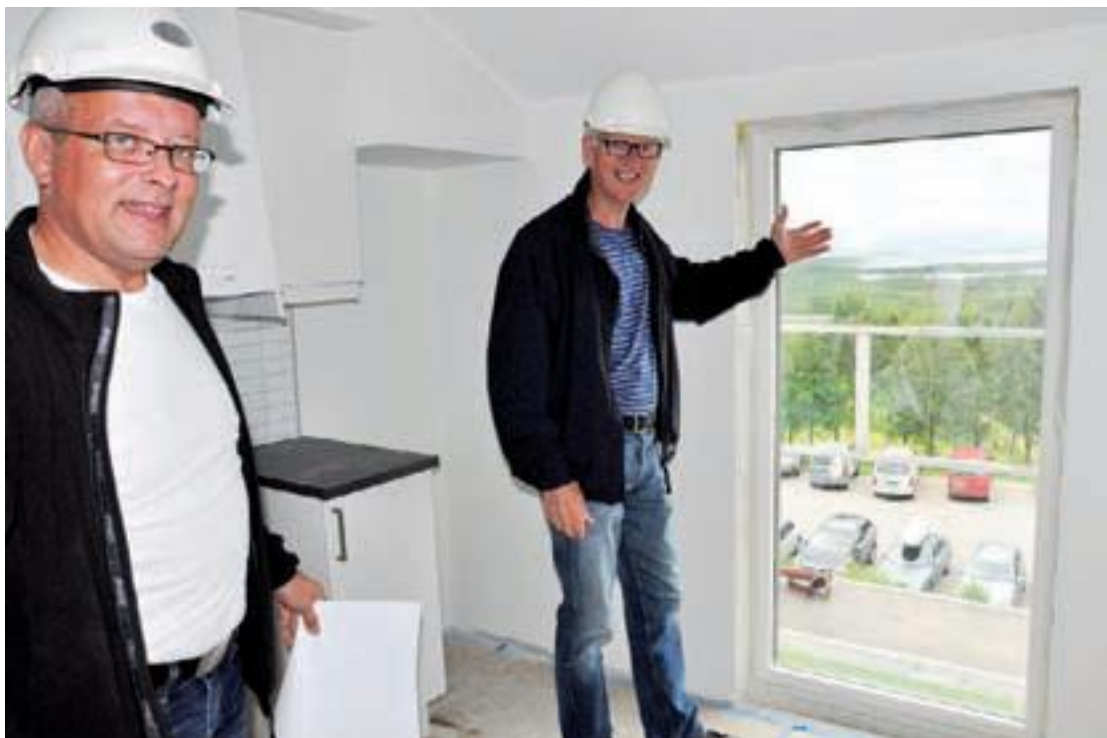
God utsikt fra loftsetasjen. Loftet har lik planløsning som de to etasjene under, men med skråtak og god takhøyde. Hyblene på loftet ligger på rundt 3800 kroner i måneden, vel en tusenlapp mer enn hyblene i sokkeletasjen.

- Hva med å ha en egen navnekonkurranse på bygget? foreslår rektor, noe Langås synes kunne være en god idé.