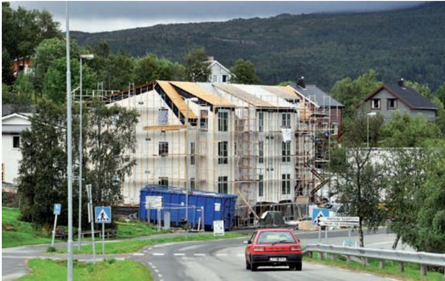
Midt i sentrum. Det gamle HT SAFE-bygget i sentrum av Oppeid har blitt betydelig utvidet til vel 800 kvadratmeter.

- Hamarøy IL har tatt på seg nedvasking av bygget for 48 000 kroner, forteller en fornøyd